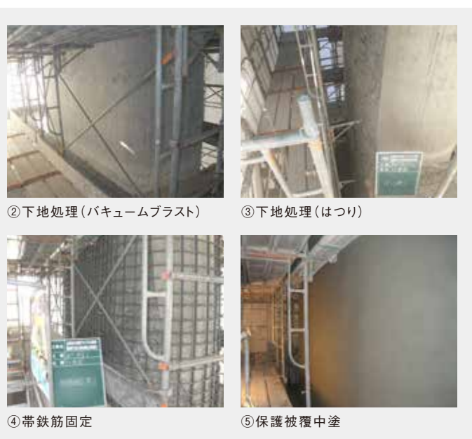
施工/(株)横浜システック