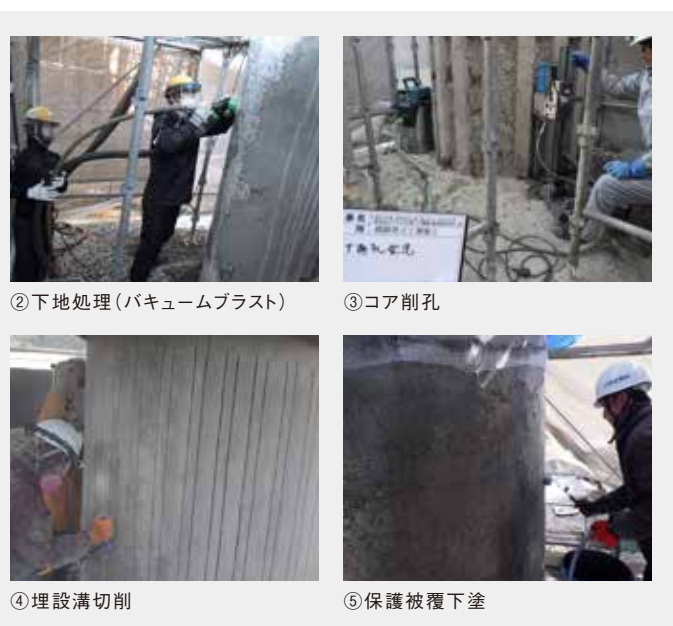
②下地処理(バキュームブラスト)