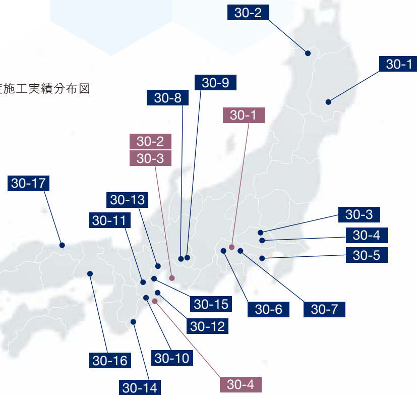
■平成30年度施工実績分布図