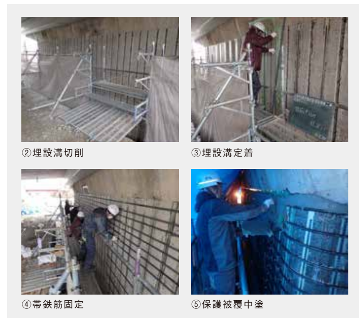
施工/(株)ライブ・レット