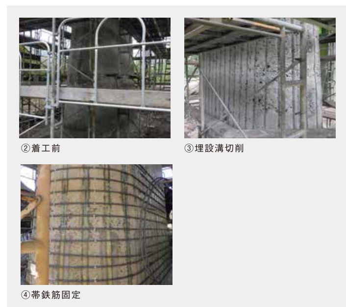
施工/(株)安部日鋼工業