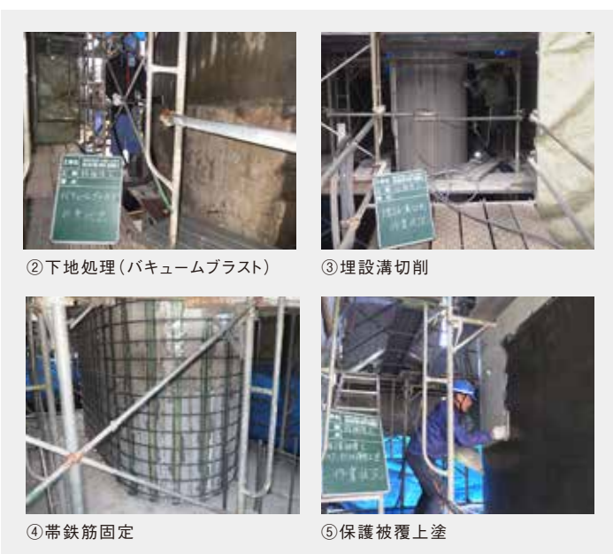
②下地処理(バキュームブラスト)