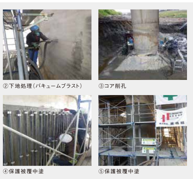
②下地処理(バキュームブラスト)