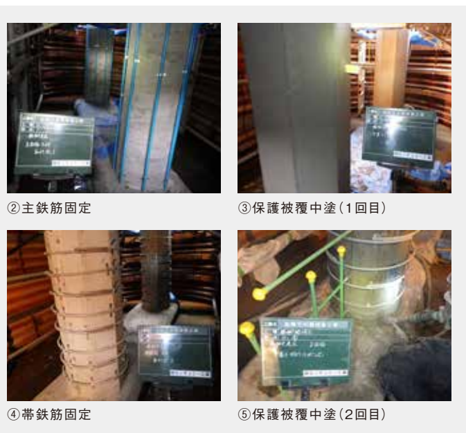
施工/秋田振興建設(株)